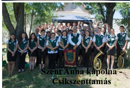
Szent Anna kápolna - Csíkszenttamás