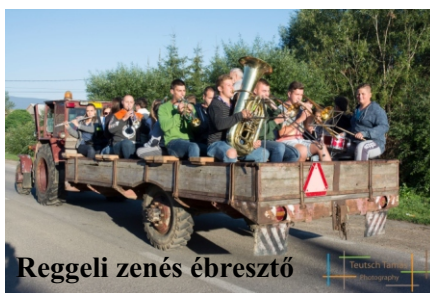
Reggeli zenés ébresztő

A búcsú előtti napon a következő programok vártak ránk: traktoros határkerülés, foci, Madicsai-borvíz, csíkkarcfalvi templom, Mózes manufaktúra, Csíkjenőfalván farmlátogatás, a Szent Anna feredő, Csonkatorony látogatása. Délután közös próbát ültünk a helyi zenészekkel: tanítottunk egypár új nótát nekik, és mi ezekért óriási szeretetet, kedvességet, odafigyelést kaptunk.