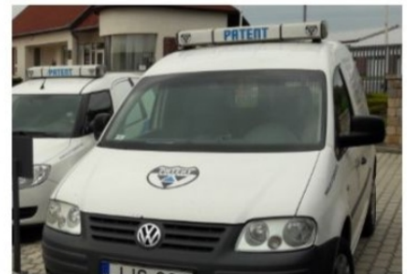
Patent autók Téten

sokkal kisebb a behatolási arány. A távfelügyelet, a riasztórendszerek sokat jelentenek, ám az igazi védelmet a kivonuló járőrök biztosítják! Azok a járőrök, azok az autók, amellyel a téti régióban csak a Patent rendelkezik!